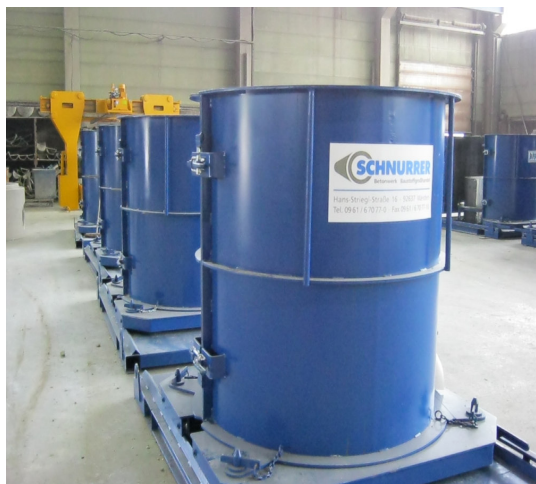
Formausrüstungen für Schnurrer Monolith-Schächte