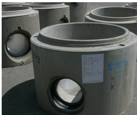
Schnurrer Monolith-Schacht für weiteren Aufbau mit Schachtbauteilen BS 2000 oder mit Spezialprofildichtung