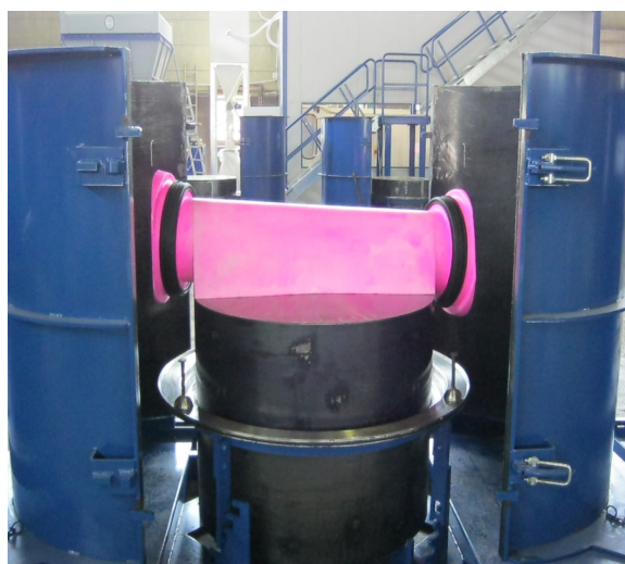
Gerinnenegativ mit Rohranschlüssen für integrierte Dichtung