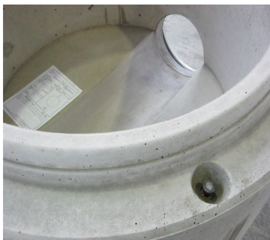
Schnurrer Monolith-Schacht mit Produktionsdokument