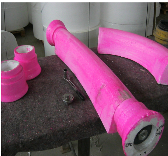
Gerinnenegative und Rohranschluss- formen nach Bestellvorgabe