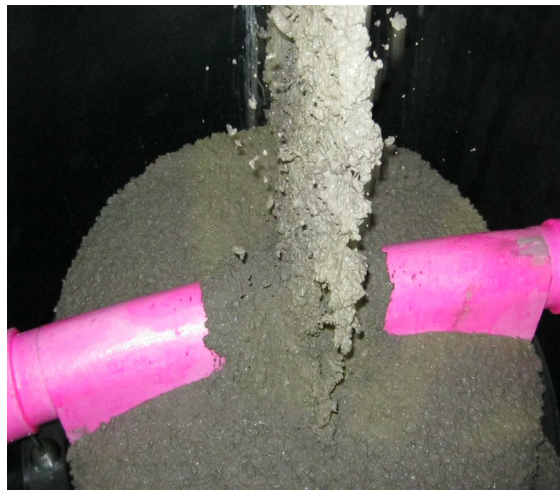
Betoniervorgang mit Beton C 40/50